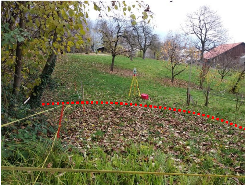
Eberliswisbach vor Einlauf Durchlass