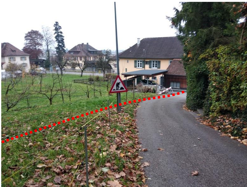
Einlaufbereich Durchlass Weiersegg- / Kantons- strasse (Fließrichtung von links nach rechts)