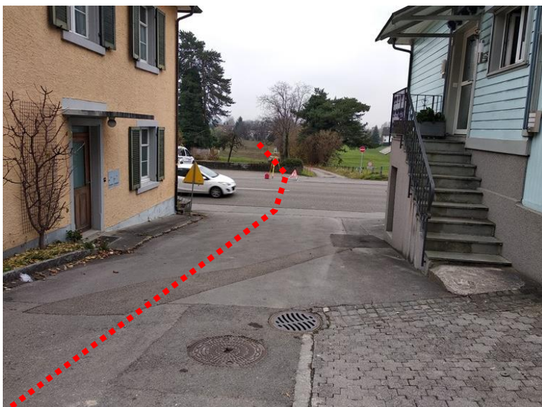
Einlenker Weiersegg- strasse in Kantonsstrasse (Fließrichtung)