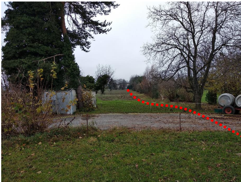
Querung Zufahrt Parz. 2415 (Fließrichtung)