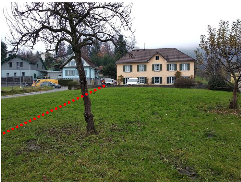
Auslaufbereich Durchlass Kantonsstrasse (Gegenfliessrichtung, Blickrichtung Kantons- strasse)