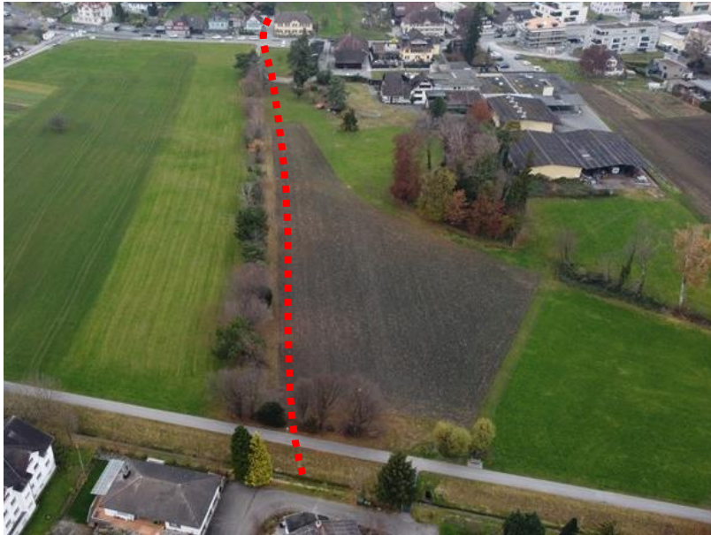
Bad Balgach / Sinkeren (Gegenfliessrichtung, Blickrichtung Nordwest)