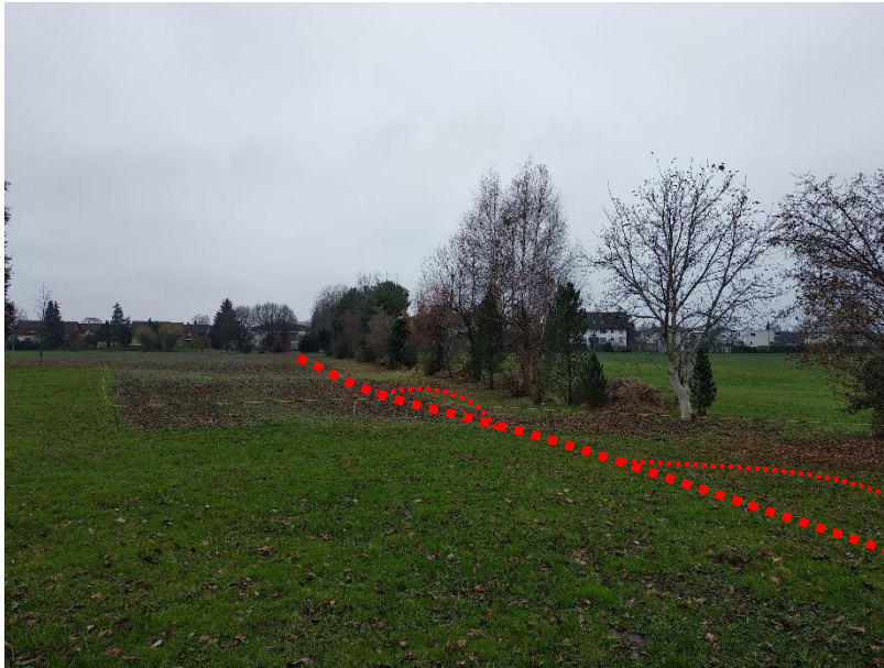
Eberliswisbach entlang bestehender Baumreihe / Hecke örtliche Gerinneaufweitun- gen (Fließrichtung)