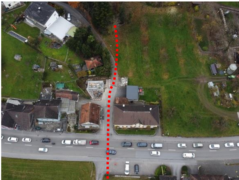
Eilaufbereich und Querung Kantonsstrasse