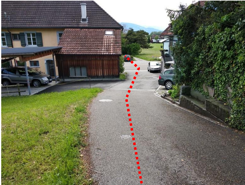
Durchlass Eberliswisbach in Weierseggstrasse (Fließrichtung)