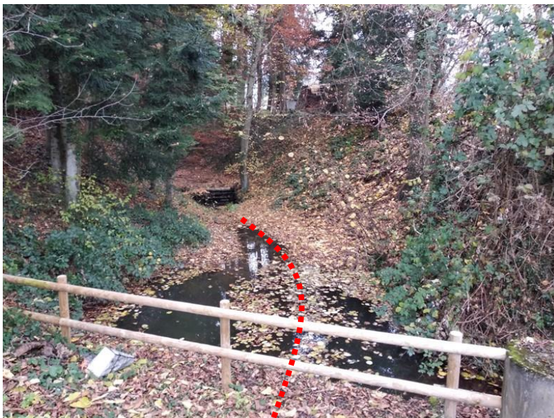
Bestehender Einlauf Eindolung / Kiesfang