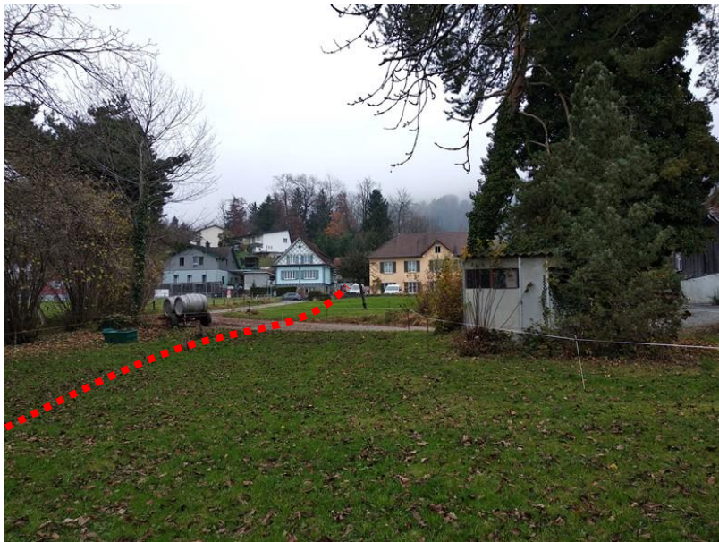
Querung Zufahrt Parz. 2415 (Gegenfliessrichtung)